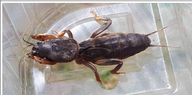
La courtilière (appelé aussi le grillon-taupe)