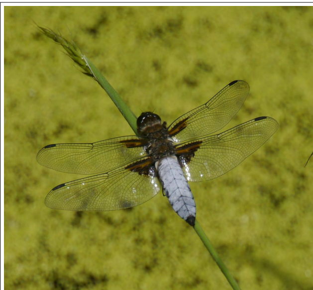
Une jolie libellule dans la petite mare