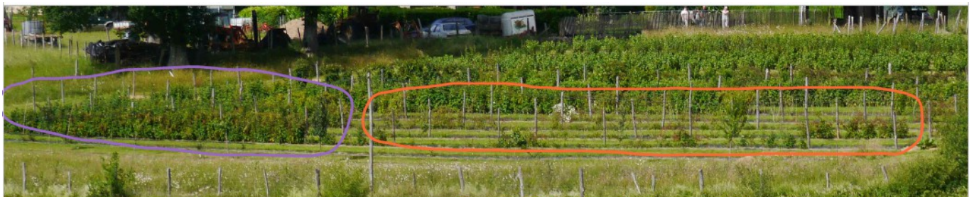
Zone Nord (violet) : framboisiers encore en vie / Zone Sud (orange) : framboisiers sinistrés !!!

Les cannes sont en train de tranquillement dépérir. C'est pas chouette du tout !!